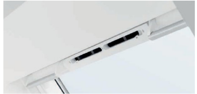
montiert, ohne Zuluftelement